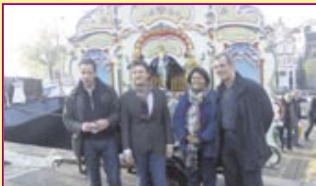
Bij de afvaart aan de Amstel, 1001 Markten Festival vorig jaar (herkent u ze?).

Laat jezelf in de boot nemen, op zaterdag 17 en maandag 19 oktober! Vaar gratis van markt tot markt